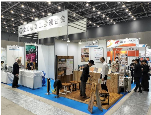
昨年の愛知県商工会連合会ブースの様子