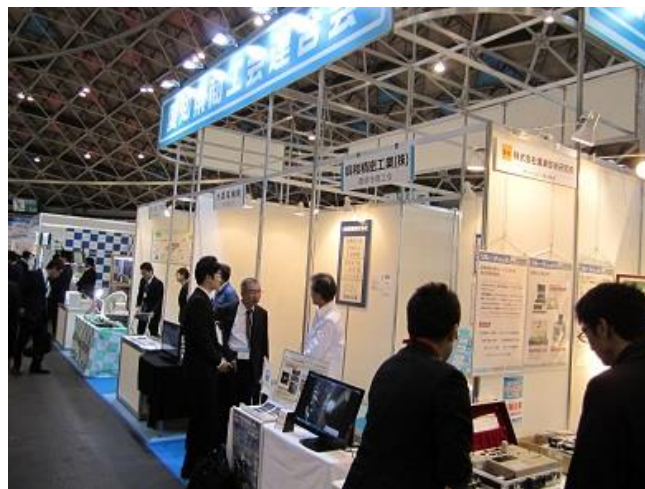
昨年の愛知県商工会連合会ブースの様子